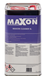
Maxon cleaner 5 L