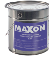
Maxon colle de contact 0,9 kg 5,3 kg