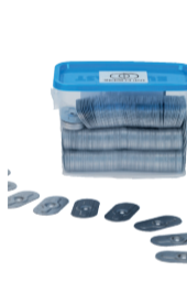
plaquettes ovales 500 pièces