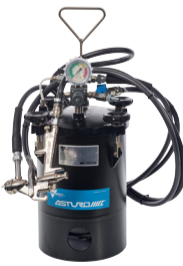
Cuve à pression