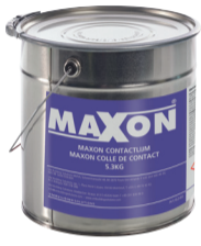
Maxon colle de contact 0,9 kg 5,3 kg