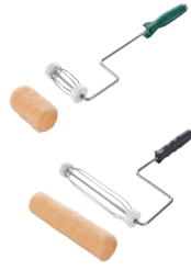
porte-rouleau + housse jetable à colle 11 cm 22 cm