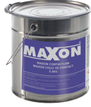
Maxon colle de contact 0,9 kg 5,3 kg