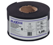
Maxon 10 cm