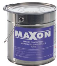
Maxon colle de contact 0,9 kg 5,3 kg