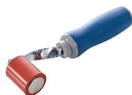
maroufleur ergonomique 4 cm