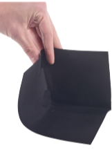
Maxon coin intérieur