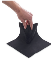
Maxon coin extérieur