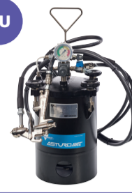
cuve à pression