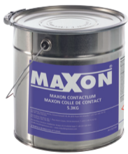
Maxon colle de contact 0,9 kg 5,3 kg